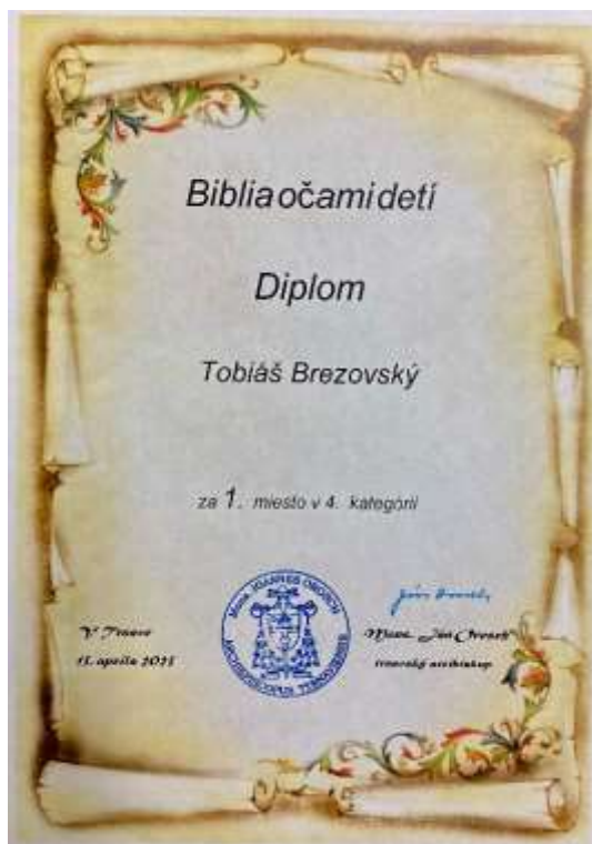
Tobiáš Brezovský, VO získal 1. miesto vo výtvarnej súťaži „Biblia očami detí“ https://dku.abuba.sk/bibl1-1-vs2023-24